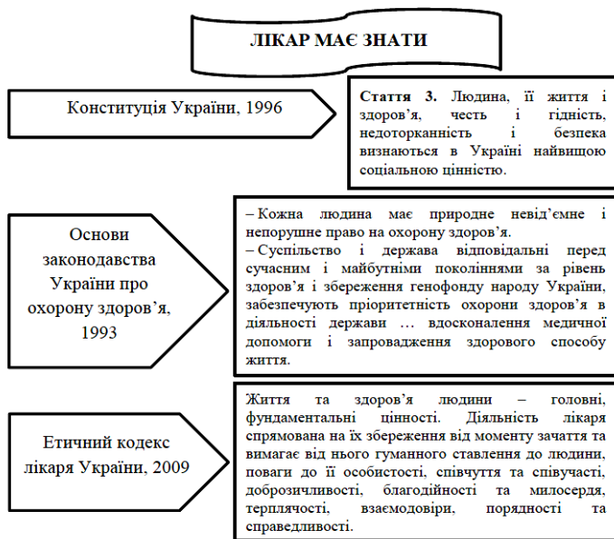
Рис. 3. Етичний кодекс поведінки медичного працівника на ринку охорони здоров'я [10]