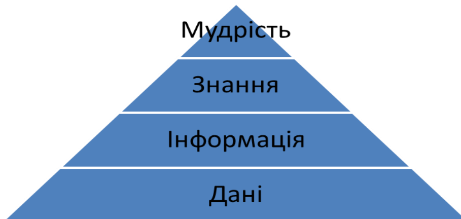
Рис. 1. Інформаційна модель DIKW [13]

Ключем до розуміння механізмів створення і накопичення знання може бути інформаційна модель DIKW (Data, Information, Knowledge, Wisdom), де кожен рівень включає в себе попередній, додаючи йому певних властивостей. В основі знаходиться рівень даних, інформація додає контекст, знання додає "як" (механізм використання), мудрість додає "коли" (умови використання) (рис. 1).