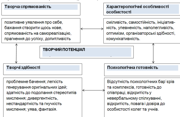
Рис. 2. Модель туристсько-краєзнавчої практики з розвитку творчого потенціалу майбутніх учителів фізичної культури

Змістова складова забезпечує всю повноту знань з туристсько-краєзнавчої підготовки, зокрема, знання теоретичних основ та особливостей практичного застосування форм, способів, напрямків та методів туристсько-краєзнавчої роботи. Вона відображає дослідно-експериментальну роботу, яка передбачає впровадження у навчальний процес дослідних груп комплексу туристсько-краєзнавчих дисциплін та авторську модель туристсько-краєзнавчої практики (рис. 2).