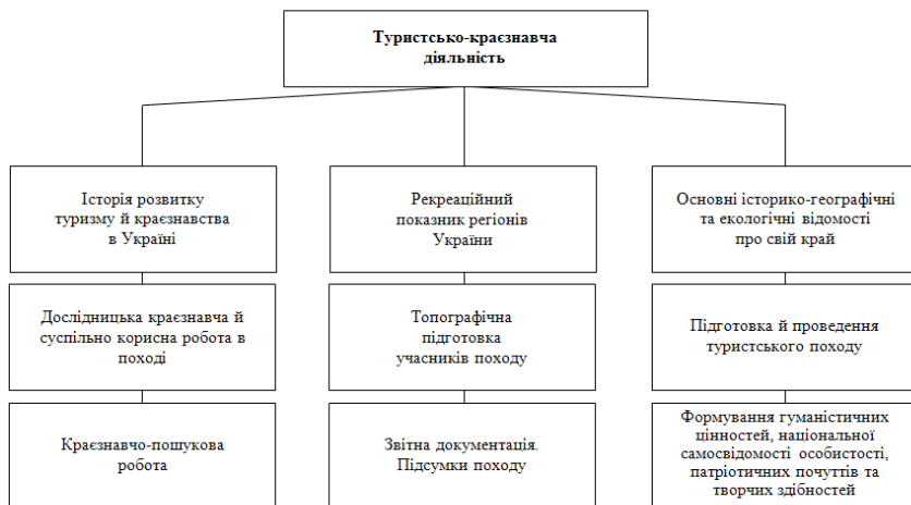
Рис. 1. Зміст туристсько-краєзнавчої діяльності фахівця зі спортивно-оздоровчого туризму

На наш погляд, слід виділити 5 вікових груп дітей, підлітків та молоді: старші дошкільнята (5-6 років), молодші школярі (7-10 років), середні школярі (11-15 років), старші школярі (16-17 років), студенти (17-22 роки). Ураховуючи ці вікові групи, слід розглядати і різнорівневі за значимістю аспекти, які різняться залежно від віку (рис. 2). Крім цього, на нашу думку, складові аспекти підготовки фахівця зі спортивно-оздоровчого туризму є: педагогічний, медико-біологічний, туристсько-краєзнавчий, психологічний, організаторський і матеріально-технічний, які різні за значущістю для окремих вікових груп дітей, підлітків та молоді.